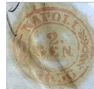
- NAPOLI 2 GEN 1856