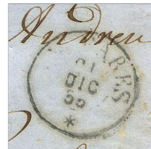
BALEARES 21 DIC 55

In pratica la lettera impiegò l'intero periodo, oggi vacanziero, documentando l'attività lavorativa dei servizi postali anche in giorni sacralmente festivi.