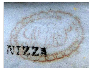
AGDP Amministrazione Generale Delle Poste