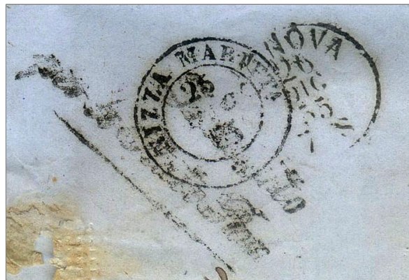
- NIZZA 25 DIC 55 – GENOVA 26 DIC 55 - PER LO STATO PONT